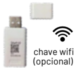
chave wifi (opcional)