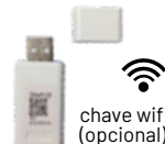
chave wifi (opcional)