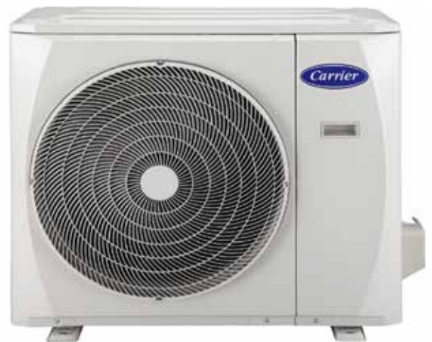
38QUS028D8S4 38QUS036D8S4-1 38QUS042D8S5-1